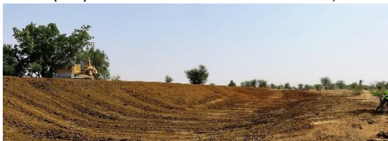
(aanleg van een van de zes dammen)